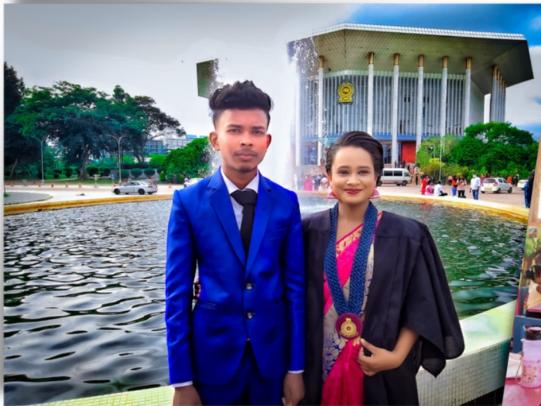
Foto: Een sfeerimpressie van onze studenten.