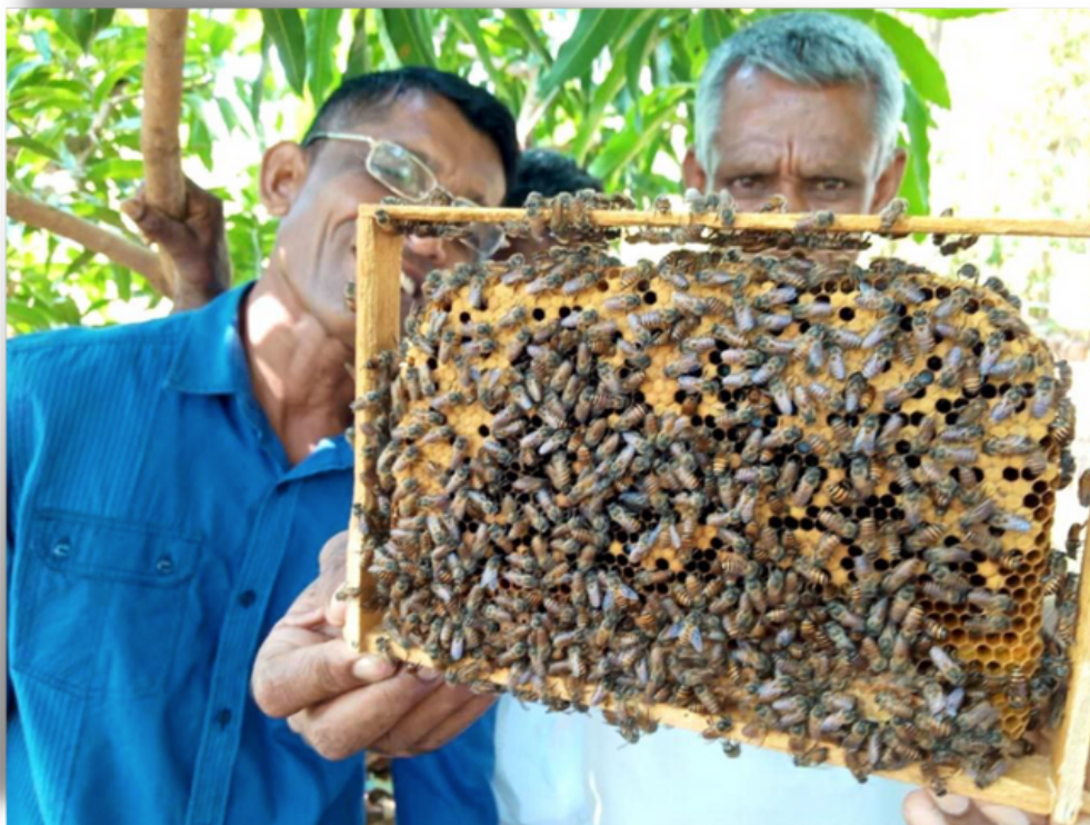
Foto: Imker uit het Vikalpa bijenproject.

Na de opheffing van de strenge Covid restricties eind december 2021 heeft er een evaluatie plaats gevonden die geleid heeft tot een heroriëntatie van het project waarbij de doelstelling van het verdrijven van de olifanten voorlopig is uitgesteld.