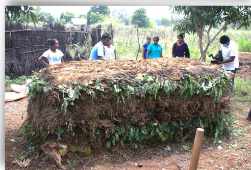
Foto: Composthoop aanleggen.