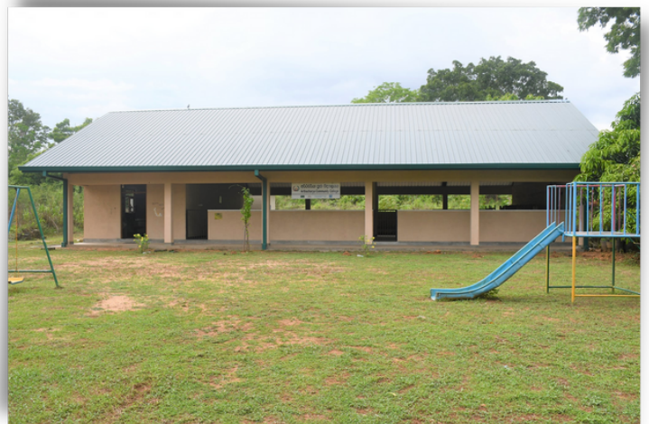
Foto: Community College in Wellawaya.

De financiering van deze 3 community colleges is gedeelde verantwoordelijkheid van Sampath en de Vebego Foundation.